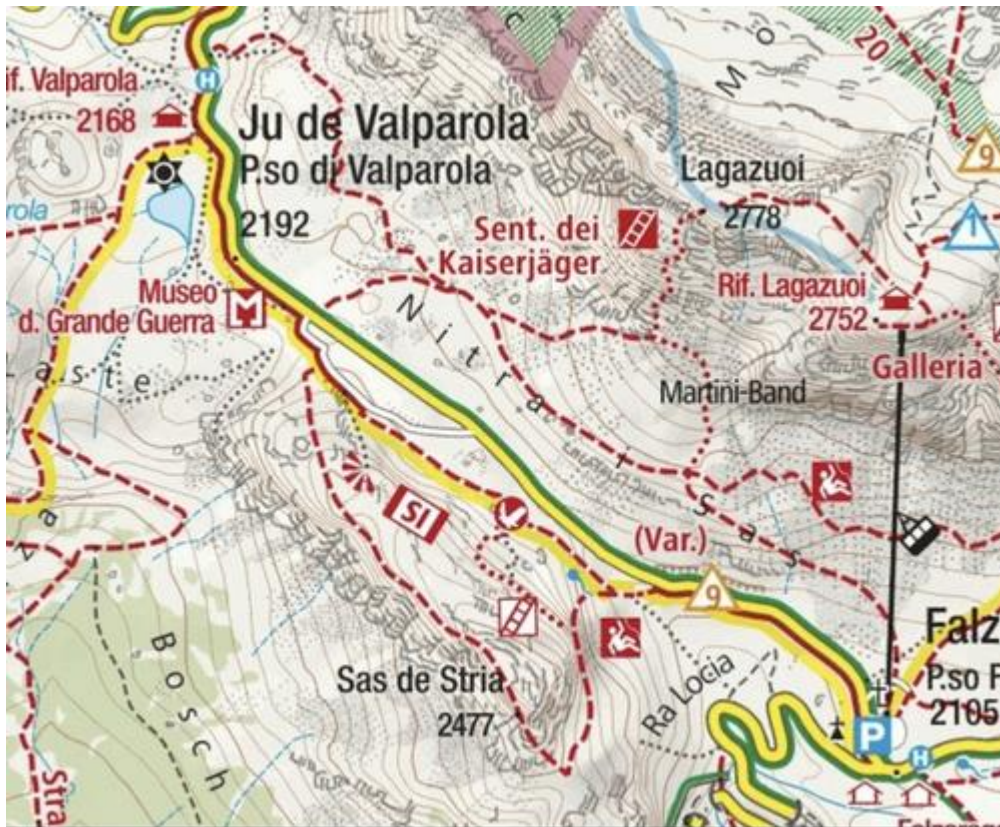
Percorso ad anello intorno al Sass de Stria