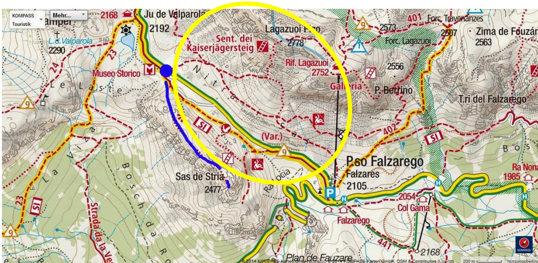
Percorso del primo giorno sulla via attrezzata Kaiserjäger