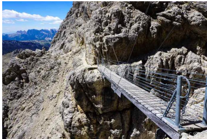
Ponte lungo il percorso Kaiserjäger

Arrivati al passo Falsarego si imbecca prima il sentiero 402, poi il nuovo sentiero a sinistra che sale verso ovest sul ghiaione di mina. Si sale sulla sinistra della montagna nella terra di nessuno posta tra le trincee austro-ungariche a ovest e quelle italiane a est. Dopo le trincee austro-ungariche si prosegue sul sentiero a zig zag, si supera il ponte sospeso, e si raggiunge l'attacco della parete attrezzata. Una volta raggiunta la cima andiamo verso il rifugio Lagazuoi, la discesa può essere fatta con la funivia, lungo il Sentiero del Fronte (sentiero CAI n. 401-402) oppure lungo il sentiero che attraversa la galleria dell'Anticima. Questo verrà valutato al momento in base alle condizioni del gruppo e in base ai tempi di percorrenza.