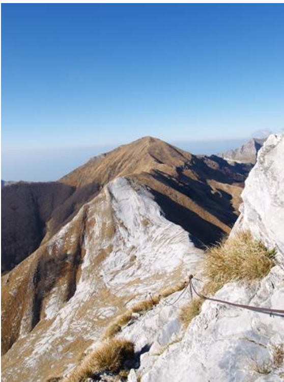
Ferrata Riccardo Malfatti

Note. I Direttori di escursione si riservano di escludere dall'attività, a loro insindacabile giudizio, anche all'ultimo momento, chiunque si presentasse con una dotazione tecnica inadeguata e di integrare, modificare il tragitto dell'escursione, fino al suo annullamento anche in relazione alle condizioni meteorologiche ed alle condizioni psicofisiche del gruppo. La partecipazione all'escursione implica che ciascun partecipante abbia preso piena ed esauriente visione della presente locandina.