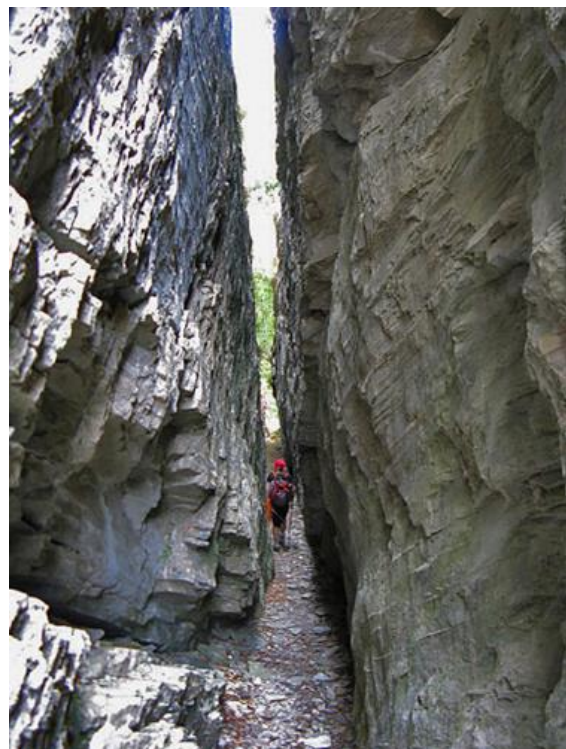
Intaglio del Giovo