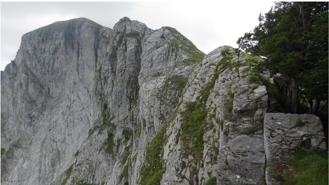
La parete sud della Penna di Sumbra